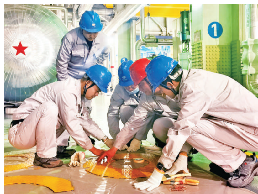
日前,河北公司沧东电厂开展“安全文明生产标准化专项整治”主题党日活动,成立党员突击队,全力消除生产现场潜在安全隐患,稳步提升现场设备健康水平。图为5月10日,该厂党员牵头开展机组厂房13.7米平台孔洞盖板防腐工作。