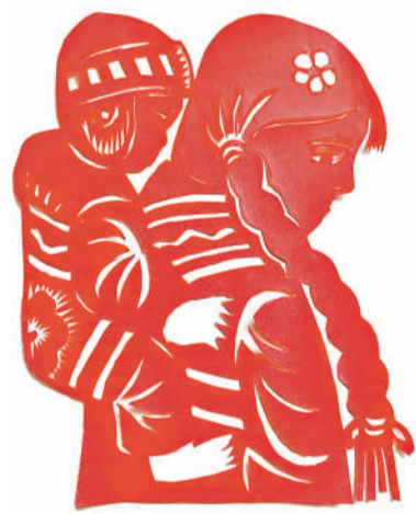
剪纸 背上的依靠 袁伟民(乌海能源平沟煤矿)