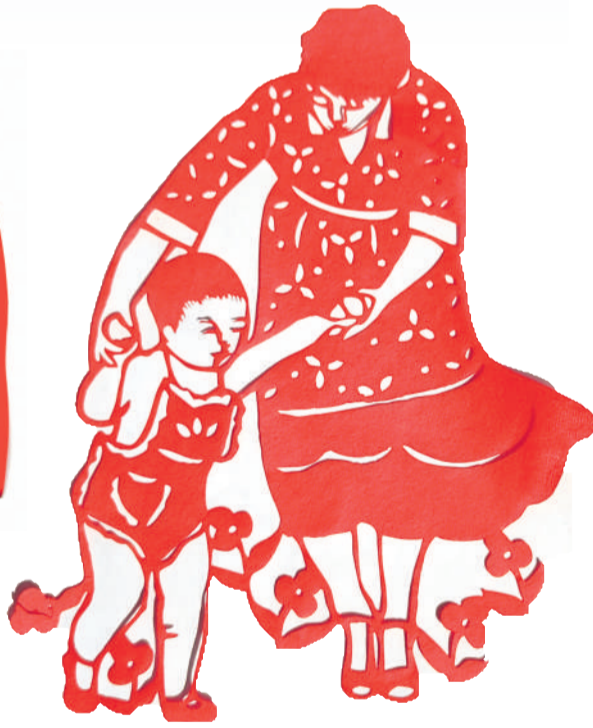
剪纸 母爱相伴 贾彩霞(焦化公司销售中心)