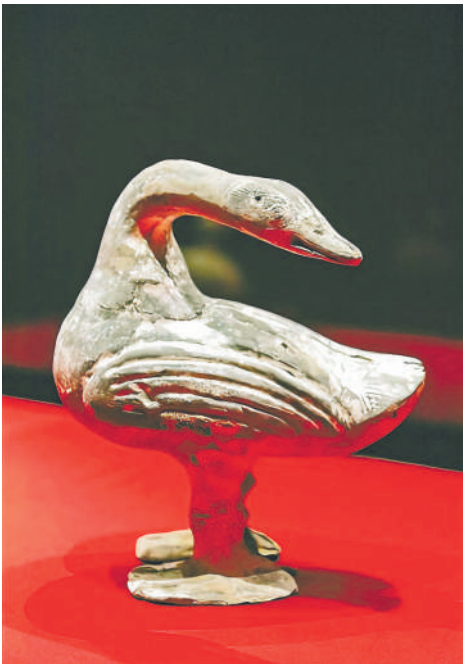
以大雁为原型的出土文物。