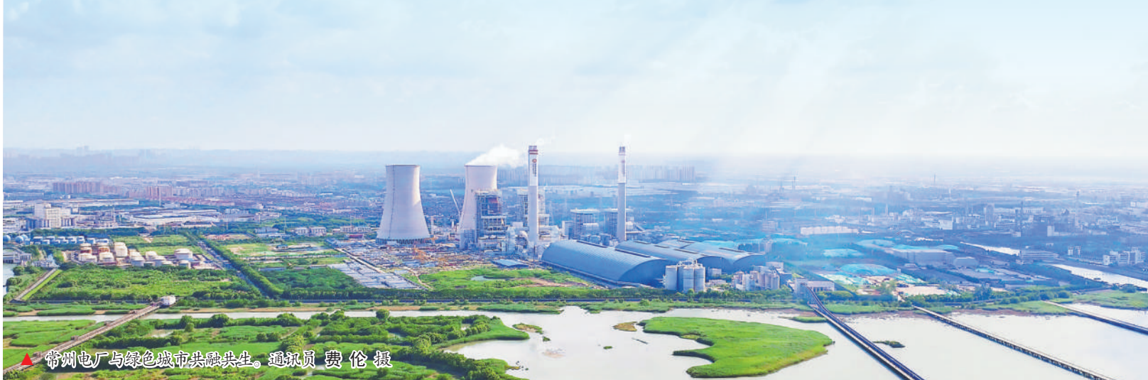
▲ 常州电厂与绿色城市共融共生。