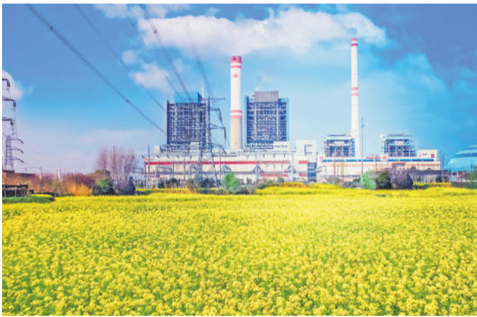
▲ 春光里的谏壁电厂。

绿水逶迤，大江拍岸。国家能源集团江苏公司始终践行“两山”理念，深耕绿色发展，让能源生产与江南水乡的灵秀诗意相融共生。本期“新视觉”以“苏韵绿染黄金岸”为主题，展现江苏公司通过技术革新，在长江之畔绘就能源与生态和谐共生的美丽画卷。