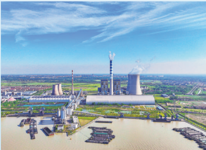
▲ 宿迁电厂码头全景。通讯员 汪利 摄