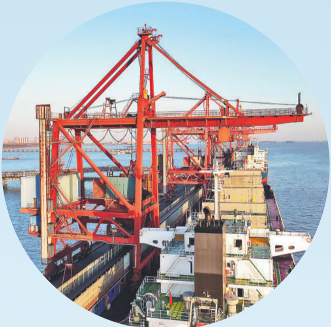
▲ 太仓电厂煤船接卸码头。