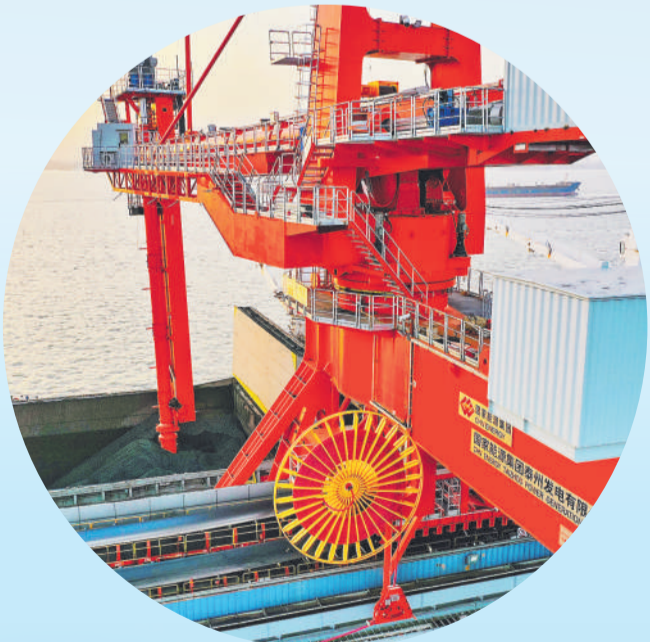
▲ 泰州电厂国内最大无人值守螺旋式卸船机正在“吸金”。