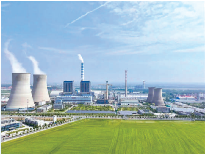
▲ 蓝天绿野中的宿迁电厂。