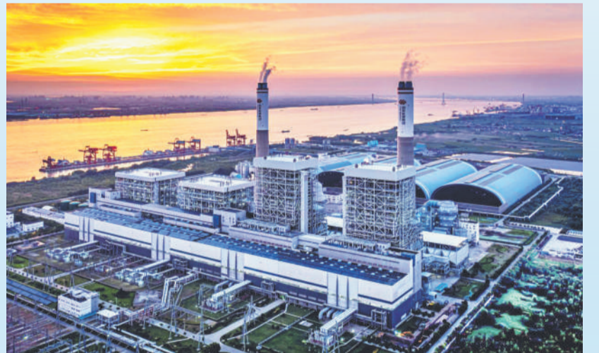
▲ 泰州电厂与绚烂朝霞共长天一色。通讯员 李慧 摄