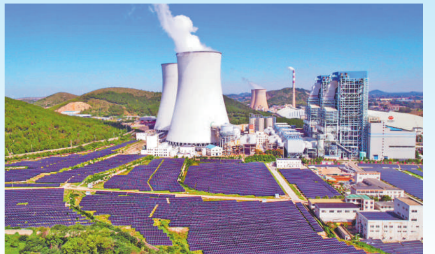
▲ 徐州电厂与青山相映成趣。