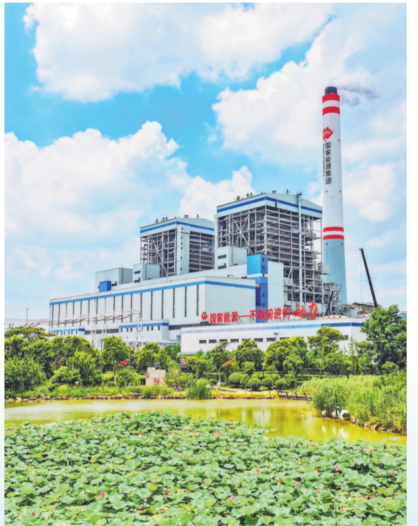
▲ 陈家港电厂在流云舒卷间铺展出一幅美丽的生态美景。