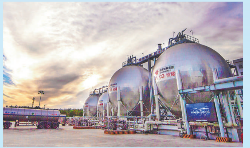
▲ 泰州电厂CCUS项目正在进行装车作业。