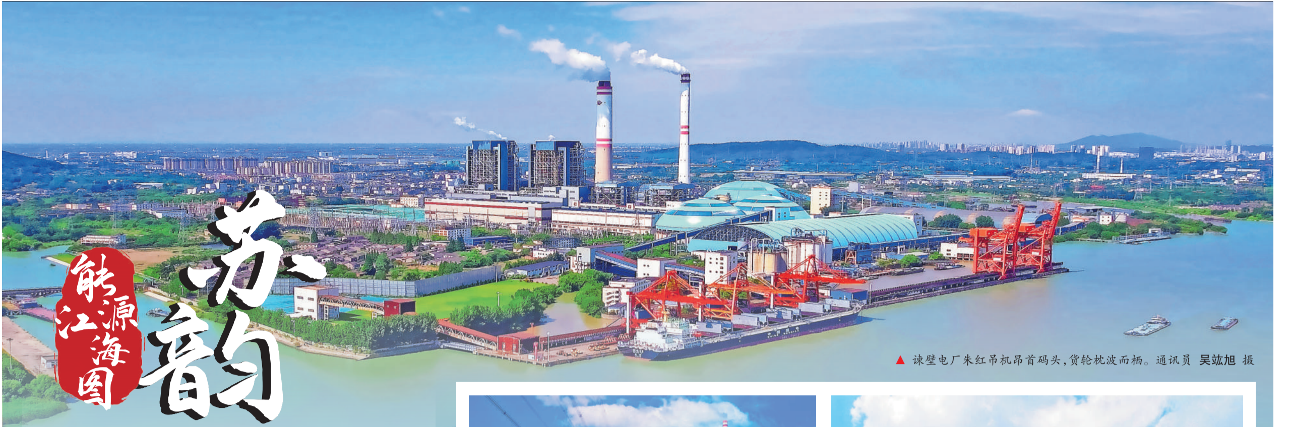
▲ 谏壁电厂朱红吊机昂首码头，货轮枕波而栖。