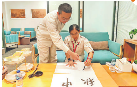
▲ 中方员工指导外籍员工写书法。