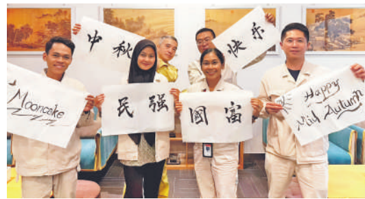
▲ 中外员工写下节日祝福。