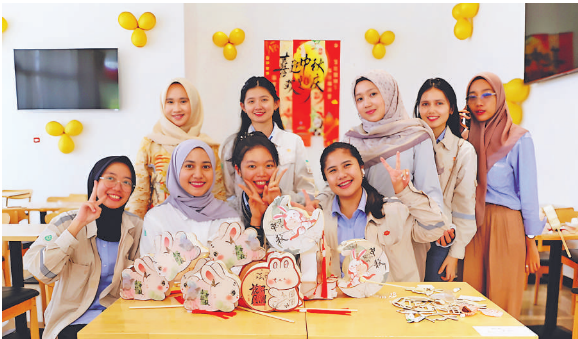
▲ 中外员工精心制作中秋玉兔花灯。

海上生明月,天涯共此时。中秋佳节之际,国家能源集团所属海外企业精心举办欢度中秋、共庆团圆庆祝活动,中外员工欢聚一堂,包月饼、写书法、话团圆,共同感受中华传统文化的魅力,进一步增进中外员工之间的感情与交流。