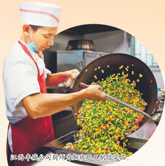
江西丰城公司厨师为加班职工制作菜品。

本报特别撷取国家能源集团双节期间，后勤战线坚守岗位的员工为保供蓄好“粮草”、鼓足干劲的动人故事，并向每一位辛勤付出的后勤员工致敬！