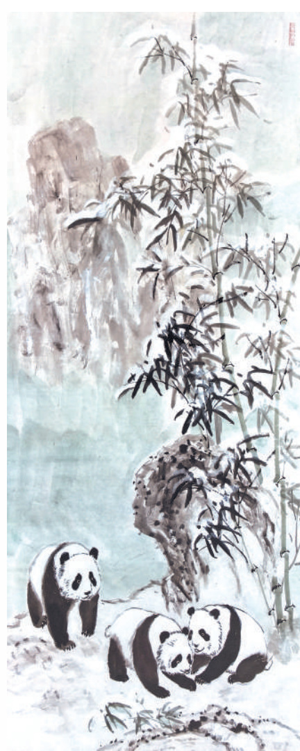
▲ 绘画 竹报平安