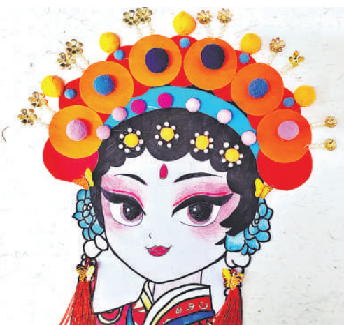
▲ 绘画 脸谱 云春丽(朔黄铁路车辆分公司)