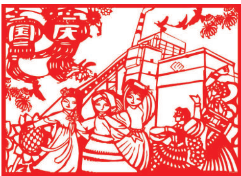
▲ 剪纸 民族欢歌 赵延玲(河北邯郸热电)