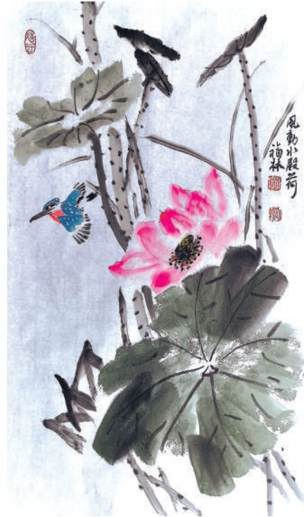
▲ 绘画 风动水殿荷

让作品兼具内涵与深度。创作之路从来不是一帆风顺。2017 年家中装修, 他临时租住的房间没有画案, 便在小饭桌上架起泡沫板, 不够高就垫块砖头。在这样的条件下, 他完成了六尺整张书法《送别》, 还在中国神华首届职工书画摄影比赛中获书法类二等奖, 成为国神集团唯一获此殊荣的员工。