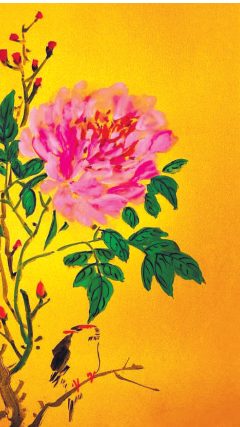
▲ 绘画 国色天香 孙利霞(江苏陈家港公司)