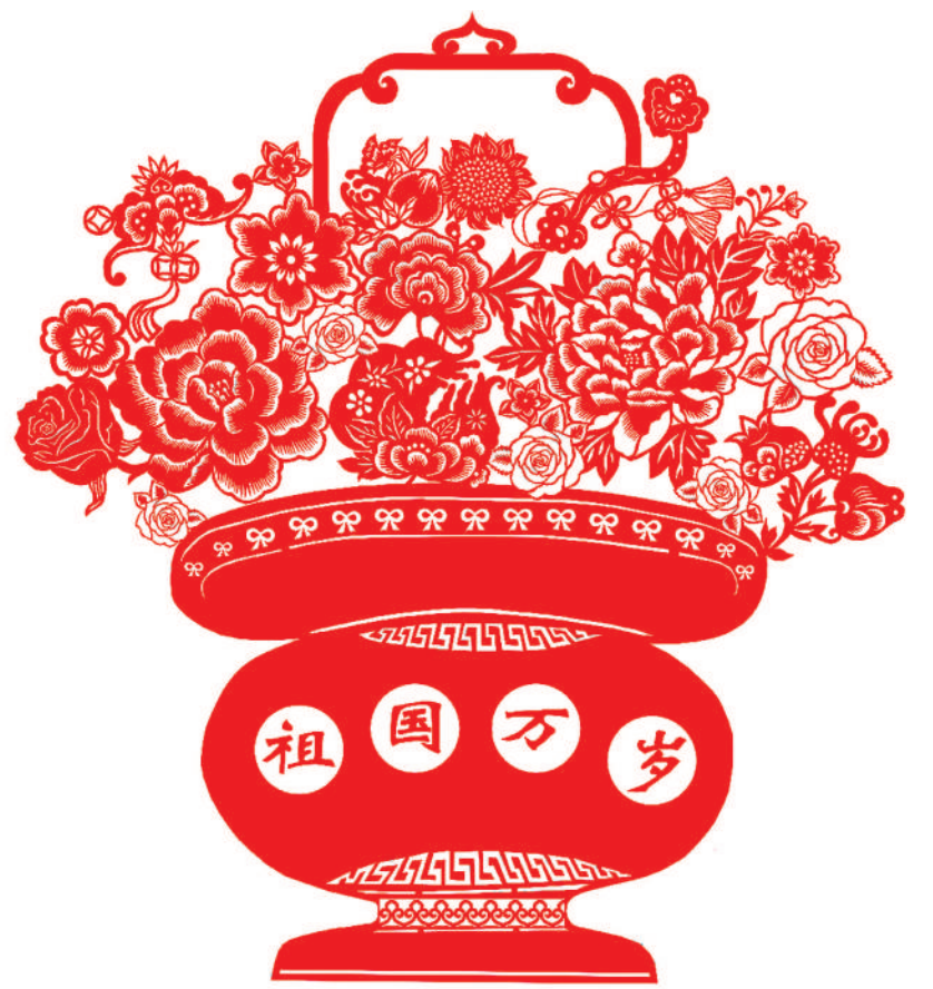
▲ 剪纸 祖国万岁 陈桂冬(承德热电)