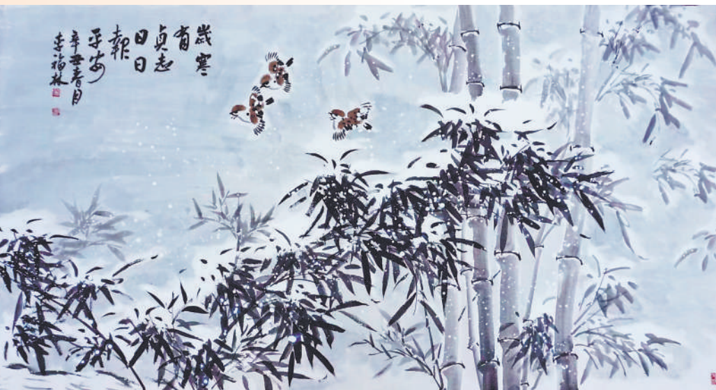
▲ 绘画 岁寒有贞志, 日日报平安