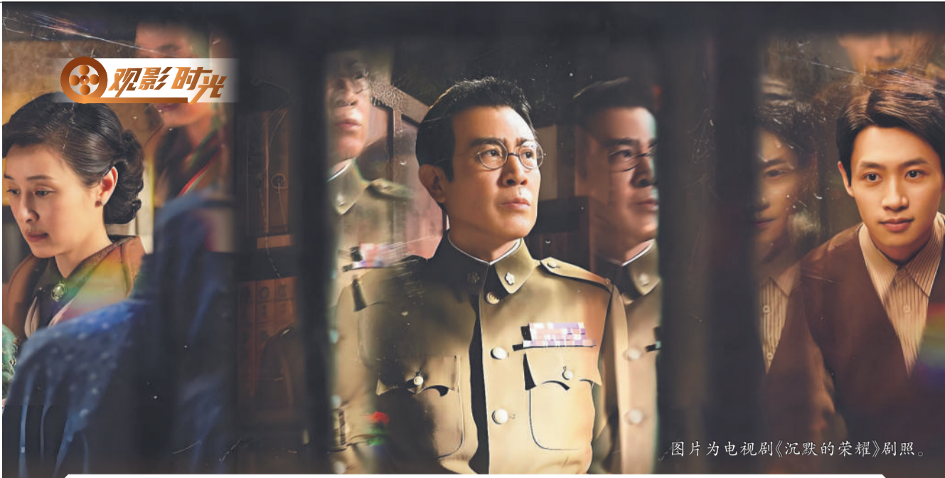
图片为电视剧《沉默的荣耀》剧照。