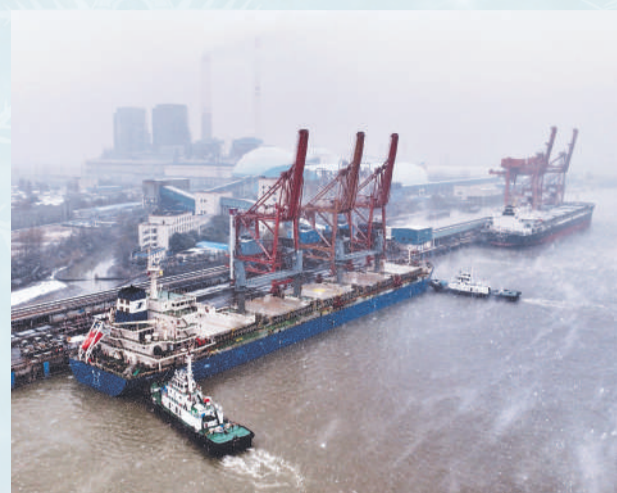
▲ 冰雪中，输煤线如一条钢铁动脉，在皑皑白雪中蜿蜒延展。传送带平稳奔腾，黑色“乌金”川流不息——这是寒天里的温度，更是冬日保供的承诺。图为江苏常州公司输煤码头。