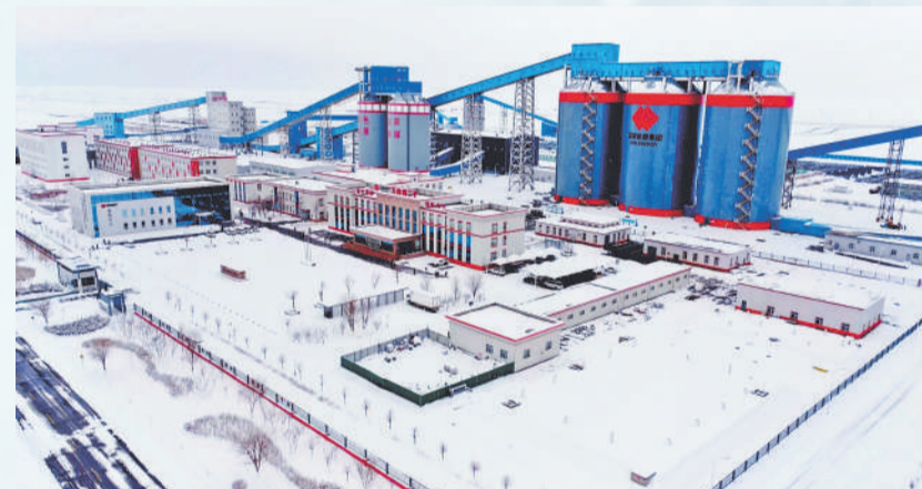
▲ 哈密大南湖二矿地面选煤系统笼罩在一片白茫茫天地间。