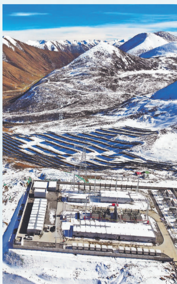
▲ 大雪下的大渡河阿水公司蒲西光伏电站。