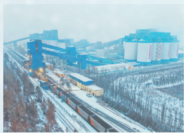
▲ 为积极应对寒潮挑战，神东煤炭多维度筑牢严寒保供防线，各矿井与洗选中心协同作战，全力确保煤炭供应。图为神东煤炭补连塔煤矿装车外运航拍图。