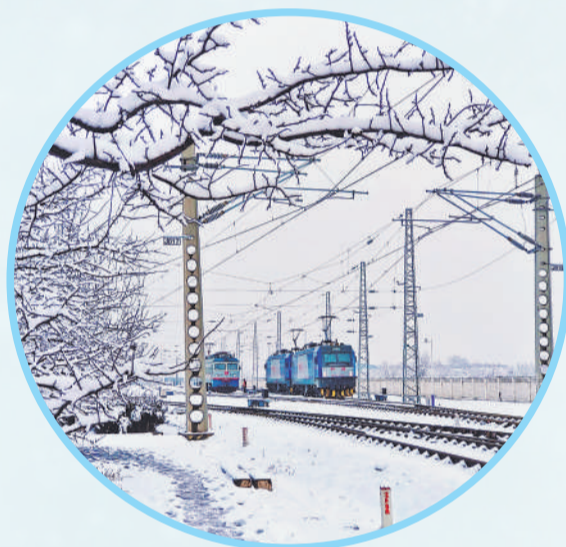
▲ 雪裹树枝垂落轨旁，新朔铁路折返所的电杆与标识牌覆盖上白霜，整装待发的机车静卧在雪覆的轨道上。