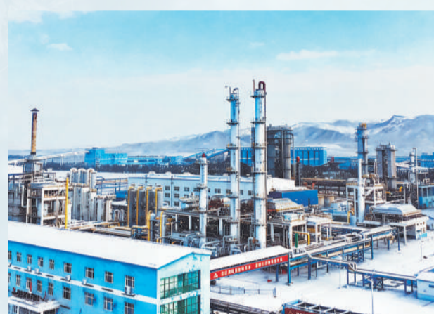
▲ 巴彦淖尔公司厂区在大雪后化作工业美学画卷，规整的管道与皑皑白雪交相辉映，硬核生产与冬日雅韵和谐共生。