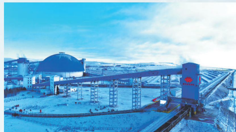
▲ 数九寒冬，在雁宝能源宝日希勒矿区，智能装车站与地面生产系统在皑皑白雪间有序衔接、高效运行，将一车车乌金及时装车外运，为东北地区发电供暖源源不断输送能源，确保人民群众温暖过冬。