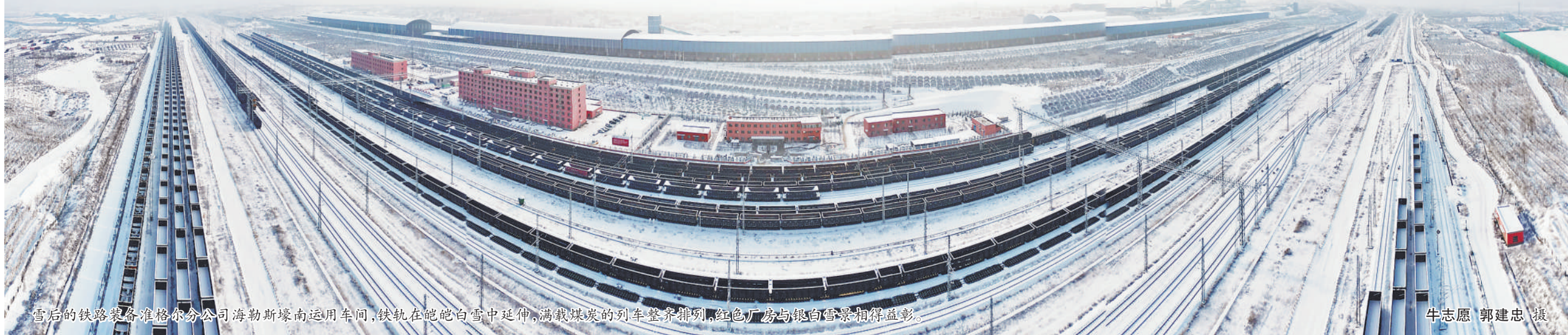
雪后的铁路装备准格尔分公司海勒斯壕南运用车间，铁轨在皑皑白雪中延伸，满载煤炭的列车整齐排列，红色厂房与银白雪景相得益彰。