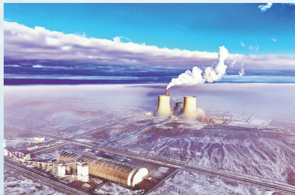
▲ 地处边疆的国神准东煤电公司在冰天雪地中守护万家温暖。