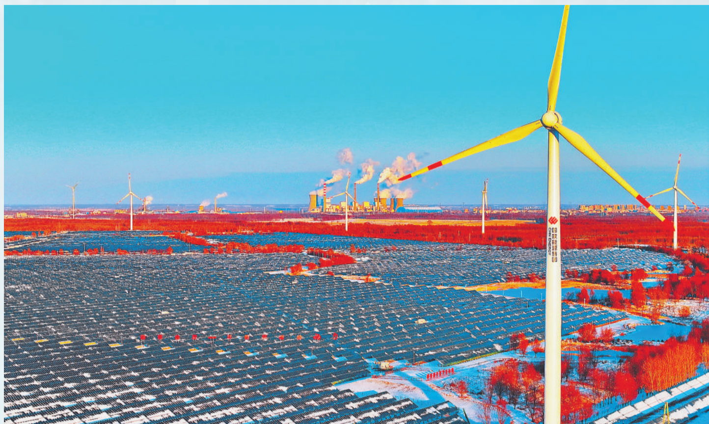
▲ 在吉林双辽公司新能源基地，冰雪与银叶、光板、厂房相融，绘就清洁能源的冬日图景。

寒冷，考验着设备的稳定，更锤炼着国人保供的担当。本期“新视觉”带您走进冰雪覆盖下的保供现场，感受极寒天气里国人坚守的身影和温暖人心的国能力量。