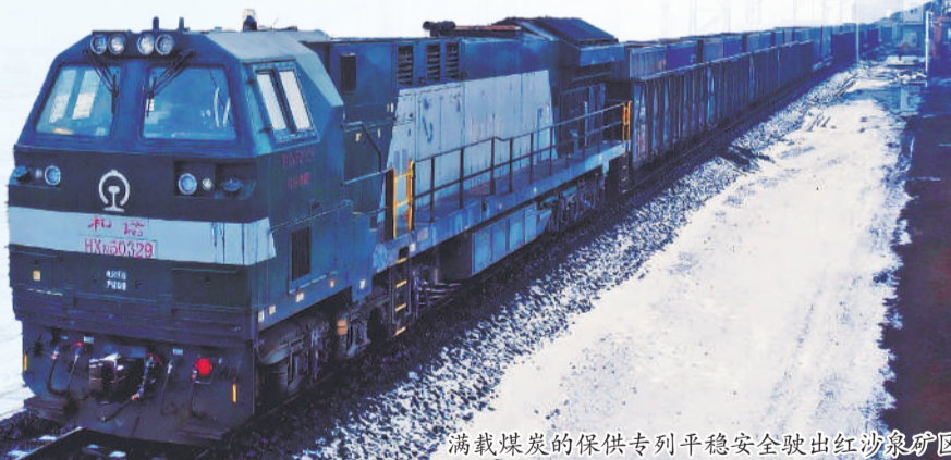
满载煤炭的保供专列平稳安全驶出红沙泉矿区。