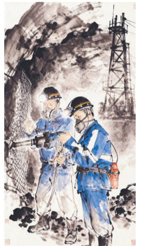
▲ 绘画 挖“光”掘“热”