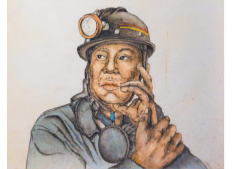
▲ 组画 矿工