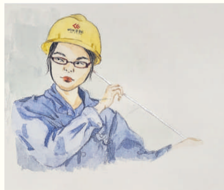
▲ 组画 一丝不苟