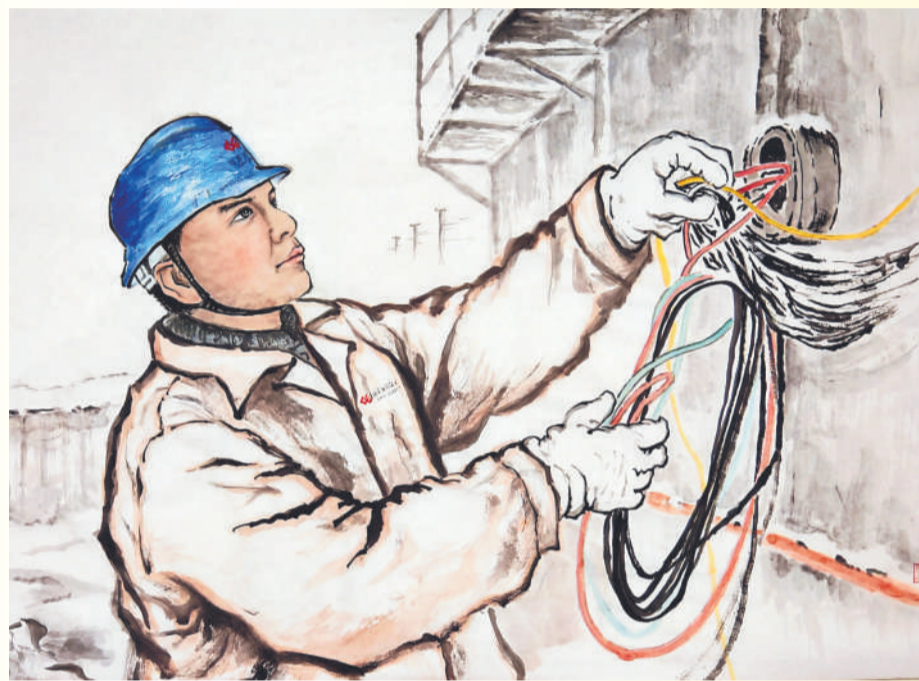
▲ 绘画 消缺