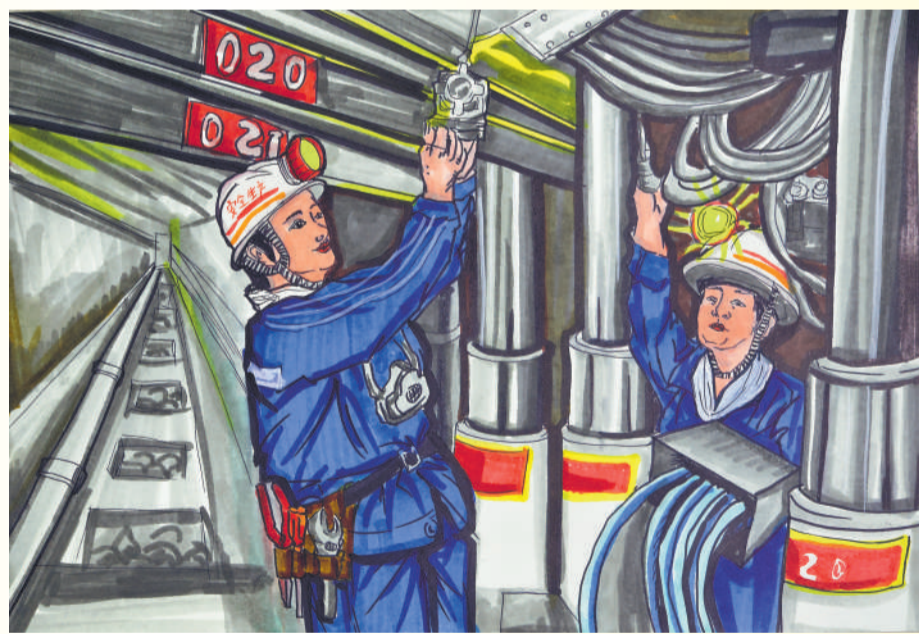
▲ 绘画 精细检修