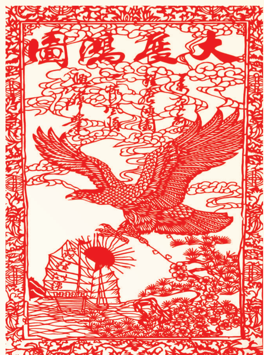
▲ 剪纸 大展宏图 张友飞(准能集团)