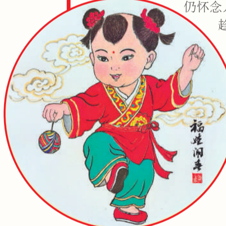
▲ 绘画 福娃闹春 韩国华(辽宁沈西厂)