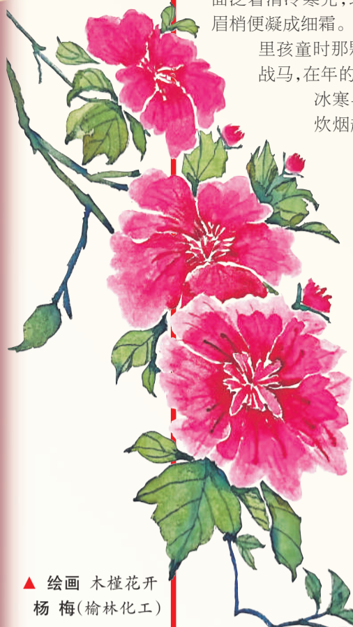
▲ 绘画 木槿花开 杨梅(榆林化工)