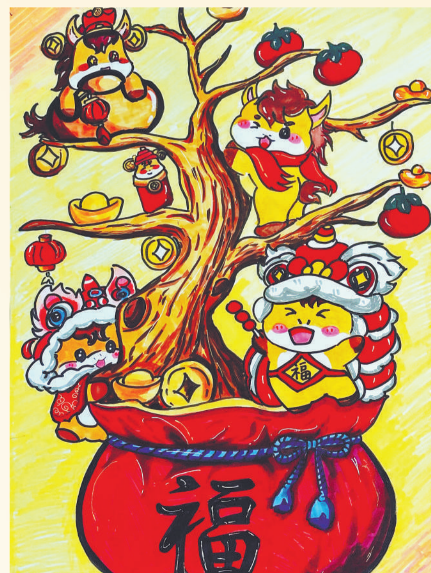
▲ 绘画 福树瑞马 宋锦铨(工程公司)