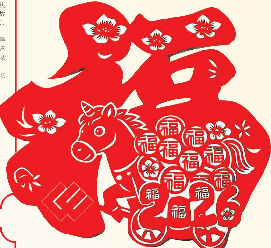
▲ 剪纸 马上有福 张仲燕(包头能源)