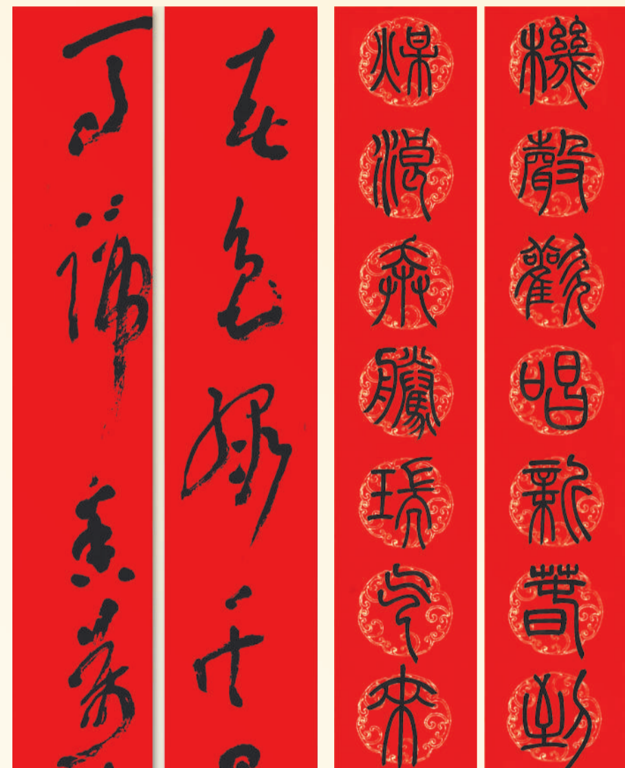
▲ 书法 爆竹声声辞旧岁 煤浪奔腾瑞气来 黄硕(榆林能源)