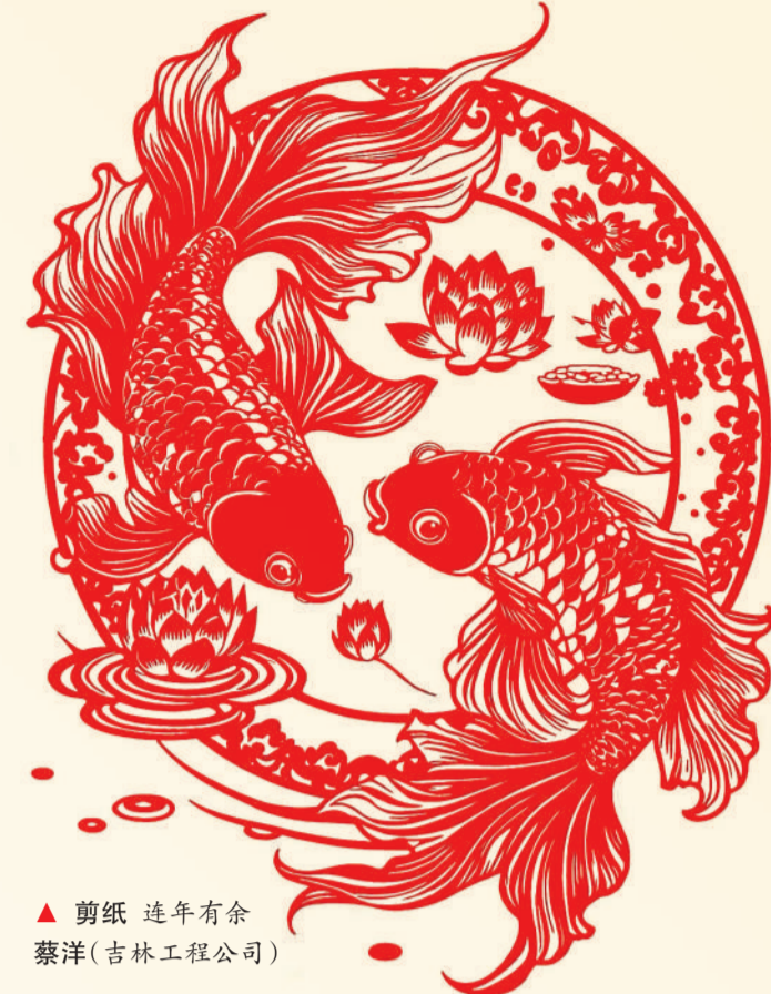
▲ 剪纸 连年有余 蔡洋(吉林工程公司)