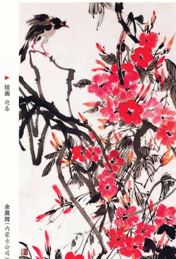
▲ 绘画 迎春 余展群(内蒙十公司)