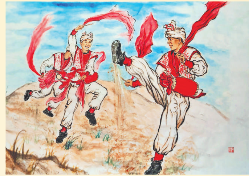
▲ 绘画 击鼓迎春 武卫国(河北公司衡水电厂)