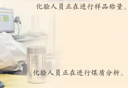
化验人员正在进行煤质分析。