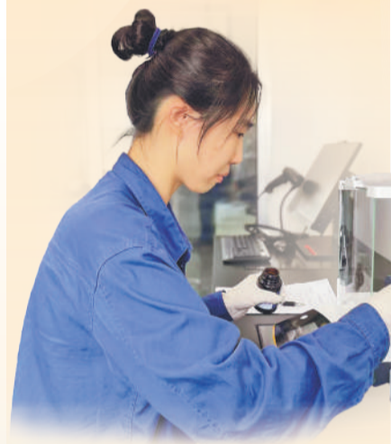
化验人员正在进行样品称量。