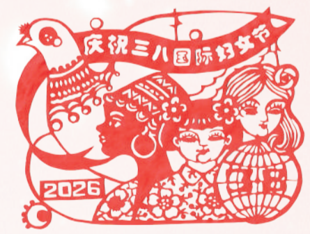
剪纸 庆祝“三八”国际妇女节 姜依肖(山东新能源)