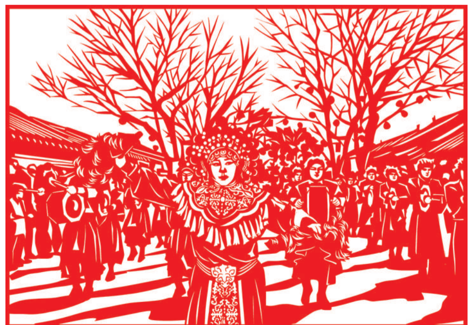
▲ 剪纸 忠勇杨家鼓