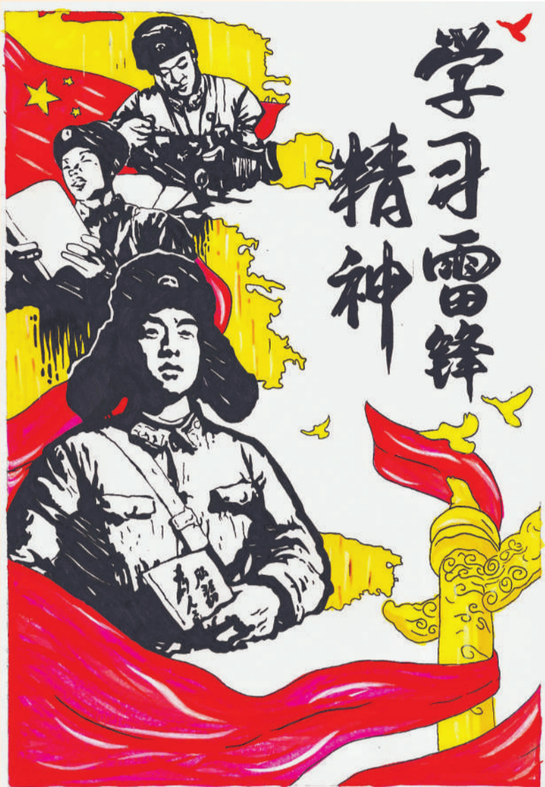
▲ 绘画 学习雷锋精神