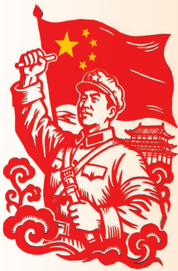
▲ 剪纸 雷鋒頌 李晶(内蒙古呼貝公司)