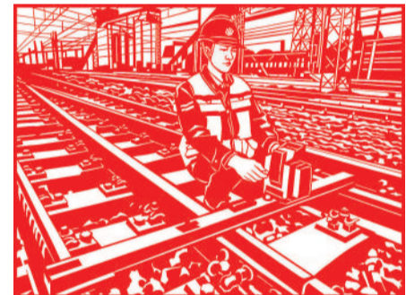
▲ 剪纸 铁轨上的守护者

立足铁路岗位，坚守艺术初心。她以匠心守艺、以初心履职，在平凡的岗位上深耕不辍，用剪纸艺术展现铁路人的劳动之美与青春活力。她的每一幅作品，都展现着铁路人劳动精神与青春活力的体现，背后凝聚着包神铁路人对工作的热爱、对生活的热忱。而她亦在岗位坚守与艺术传承中，创造美、收获美、升华美。