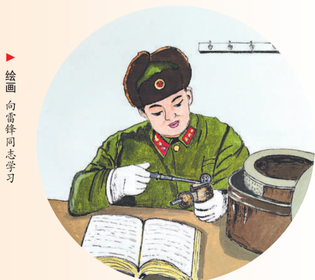
▶ 绘画 向雷鋒同志学习 韩国华(辽宁沈西厂)