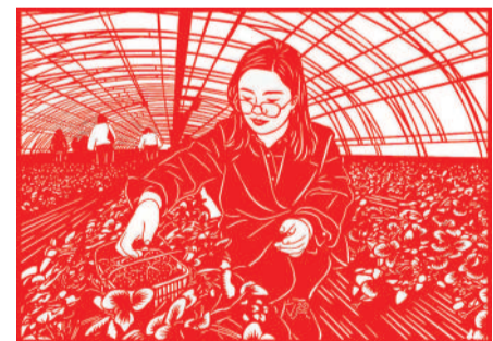
▲ 剪纸 春禧