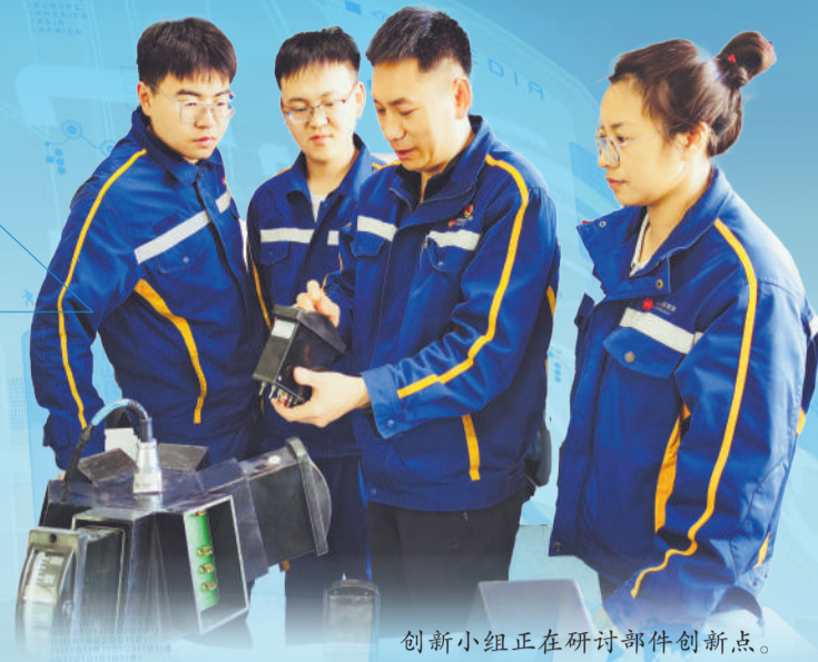
创新小组正在研讨部件创新点。