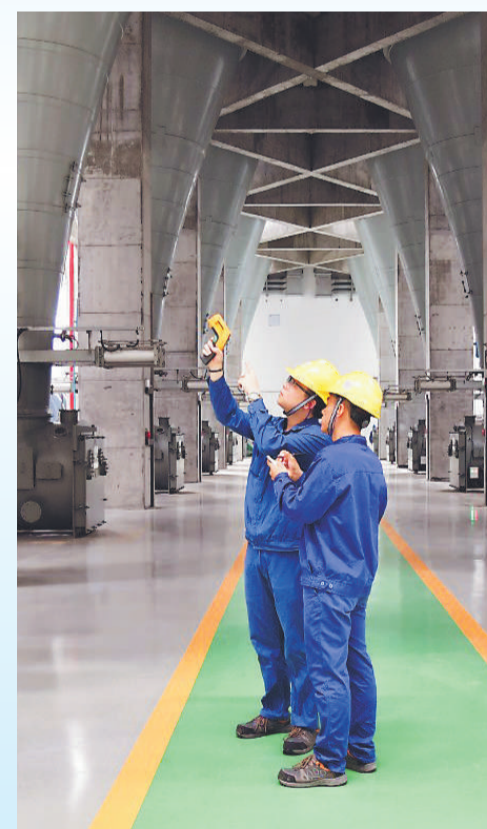
▲ 湖南公司运维人员认真排查隐患,为千家万户送去清凉与光明。图为巡检员正在检查锅炉原煤仓和给煤机。