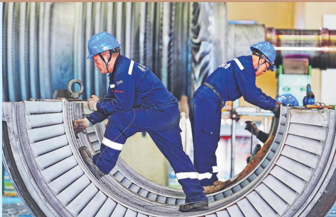
▲ 黄金埠公司检修人员铆足干劲、精益求精,高标准推进2号机组A修各项作业,全力打造检修精品工程。图为检修人员正在更换汽轮机中压持环汽封齿。

盛夏将至,能源保供即将进入关键攻坚期。国家能源集团所属企业胸怀“国之大者”,锚定“三个转型”,以“时时放心不下”的责任感,统筹发展与安全,全力备战迎峰度夏。从井下设备精修到发电机组维保,从线路隐患排查到风机设施巡检,国能人战高温、忙检修,抓实设备提质消缺,筑牢安全生产坚实防线,全力夯实迎峰保供根基,用心守护万家灯火与社会发展用能,聚力奏响夏日能源保供奋进乐章。