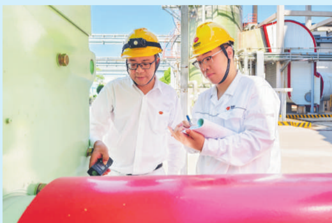
▲ 江苏谏壁公司运行人员直面高温“烤”验,认真排查循环浆液泵运行状态,筑牢迎峰度夏电力保供安全屏障。图为运行人员在烈日下记录设备运行数据。