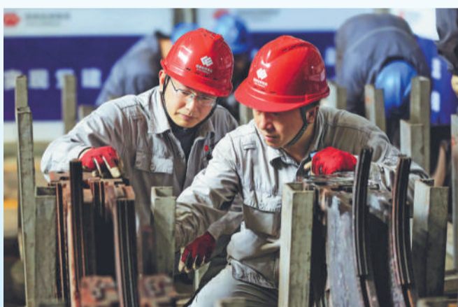
▲ 入夏以来,辽宁热力公司结合生产实际,采取日检和定期检查与定期维护保养相结合方式,对设备进行检修维护。图为检修人员正在检查4号汽轮机隔板和隔板汽封条修前状态。