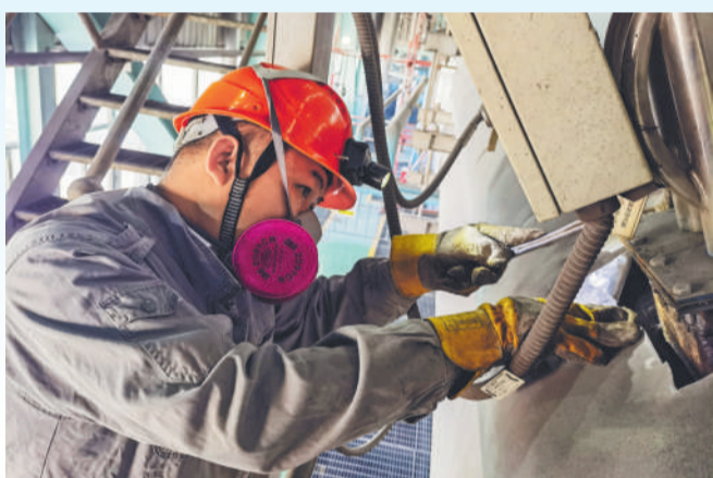
▲ 辽宁沈西厂职工不惧高温炎热,全力保障机组稳定运行。图为5月12日,该厂维护部职工进行制粉系统送粉管道检修作业。