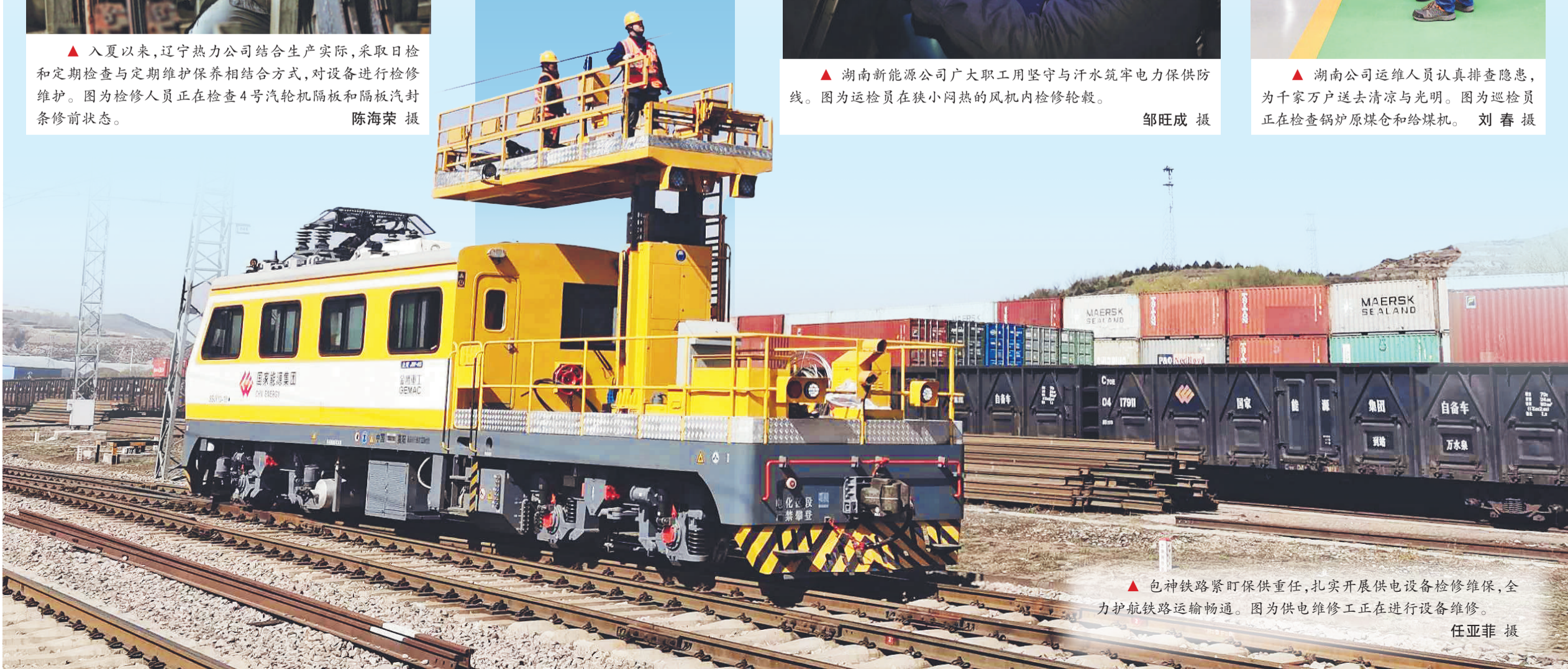
▲ 包神铁路紧盯保供重任,扎实开展供电设备检修维保,全力护航铁路运输畅通。图为供电维修工正在进行设备维修。