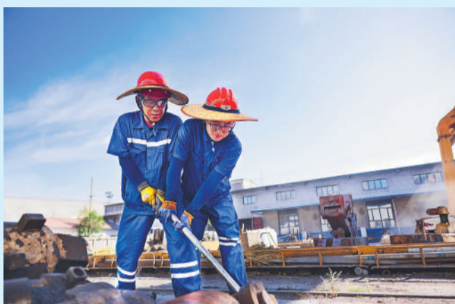
▲ 乌海能源持续加大井下设备检修力度,从严把控设备故障隐患,全力保障矿井安全生产平稳有序。图为平沟煤矿维修中心工作人员检修超前支架油缸。