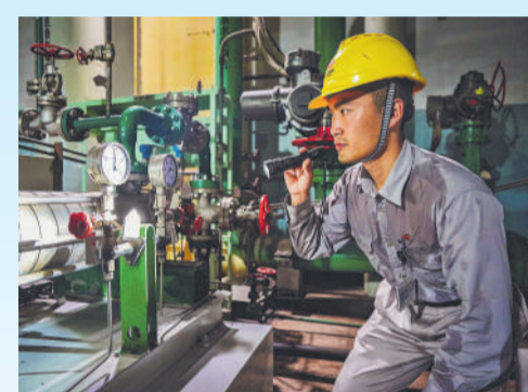
▲ 为打好迎峰度夏攻坚战,浙江公司全力做好生产运营各项工作。图为浙江公司北仑电厂运行巡检员不顾汗湿衣衫,一丝不苟执行巡回检查任务。