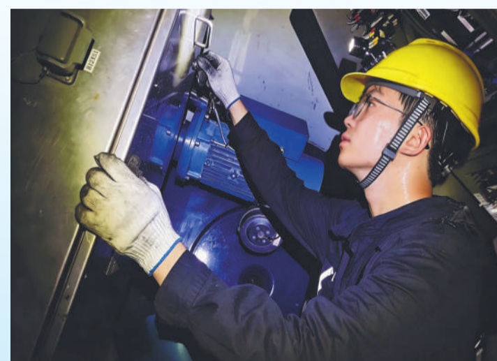
▲ 湖南新能源公司广大职工用坚守与汗水筑牢电力保供防线。图为运检员在狭小闷热的风机内检修轮毂。